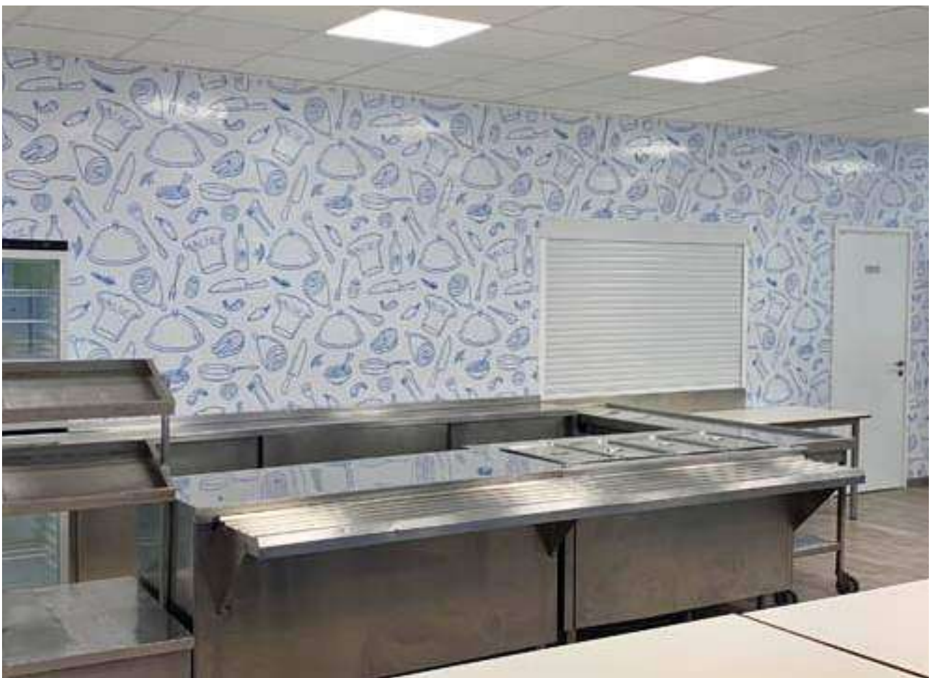
Reformas del comedor y la cocina del colegio.