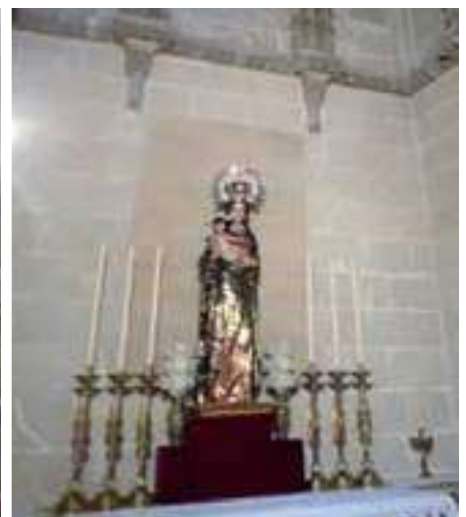
Catedral de Cádiz