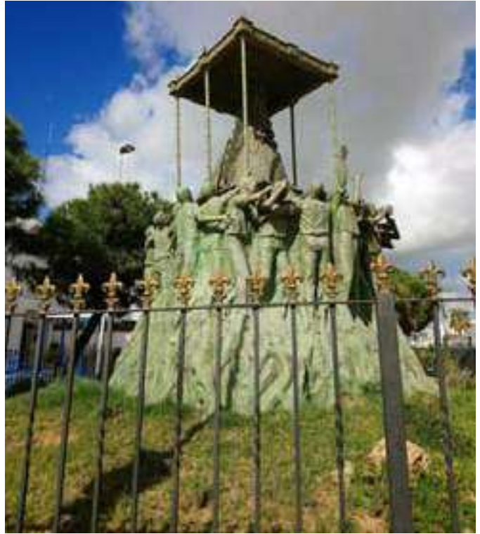
Capilla del Pópulo - Escultura del Rocío de Sanlúcar de Barrameda