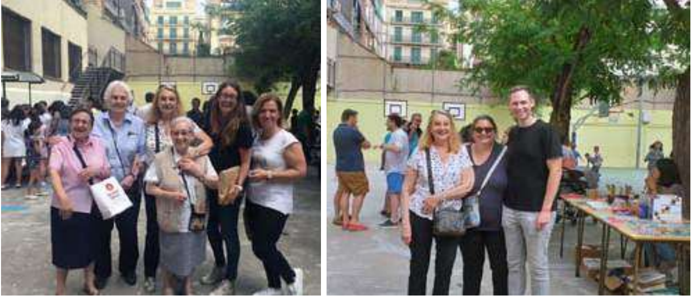
Grupo de Antiguas/os Alumnas/os y Hermanas de la Comunidad.

Damos la enhorabuena a toda la promoción que en junio terminó con éxito su camino escolar, eso incluye la bienvenida al nuevo nivel, la veteranía es siempre un grado.