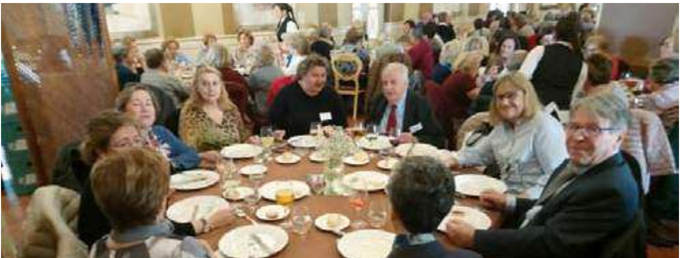
Cádiz: Comida en El Baluarte de los Mártires